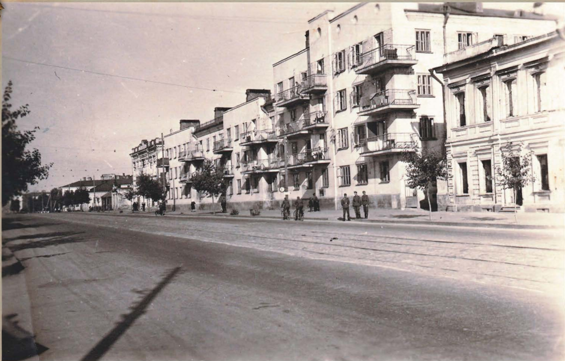
Оккупация. Орел, улица Московская