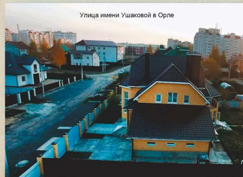
Улица имени Ушаковой в Орле