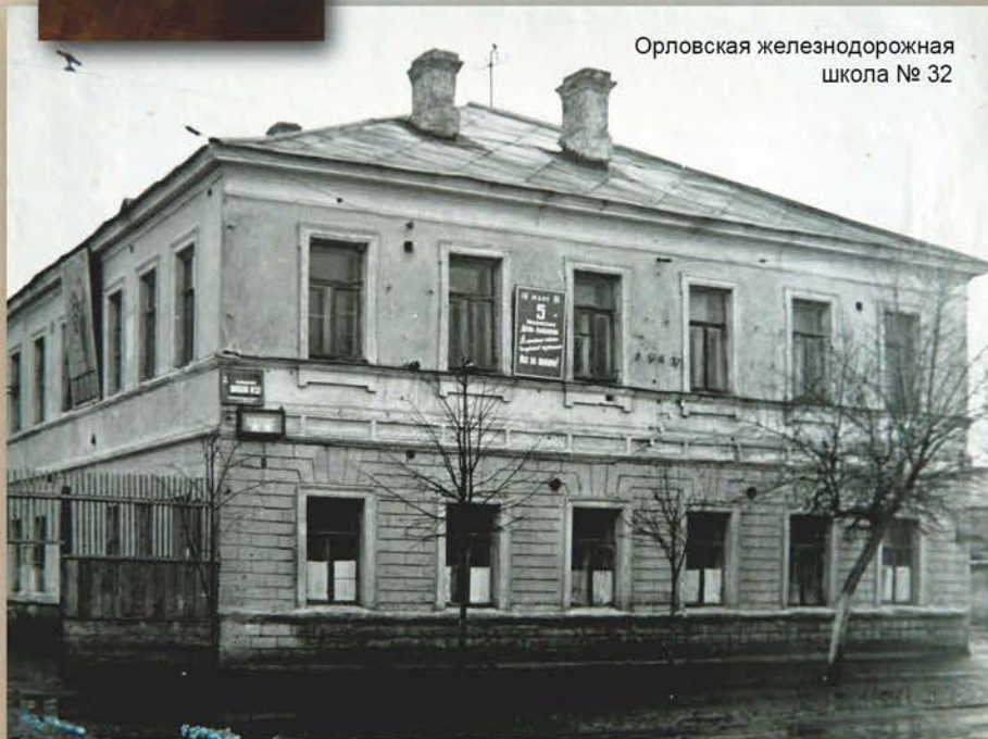
Орловская железнодорожная школа № 32