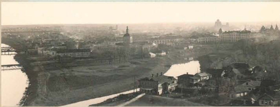
Оккупация, Орел, Левый берег Орлика

После взрыва предполагалось, что все участники, в том числе Ушакова, покинут город и направятся к партизанам. Но оказалось, что это задание было последним, вскоре стало известно об аресте и гибели в гестаповских застенках Ушаковой и многих участников комсомольской подпольной группы.