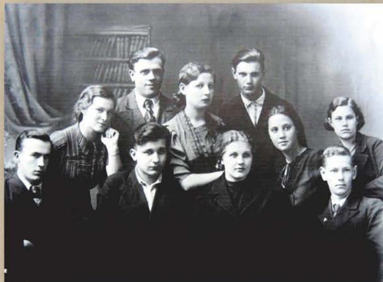
Выпускники 10-х классов 32-й школы города Орла 1941 года