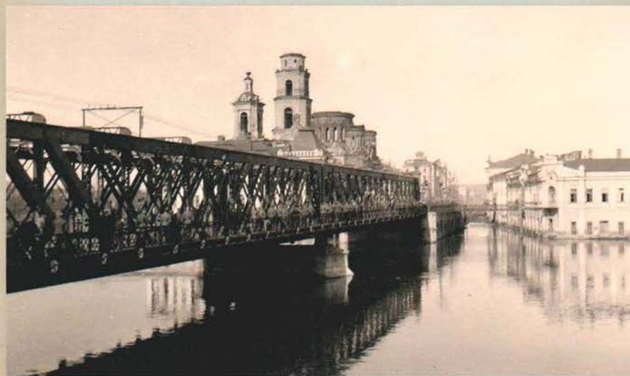
Оккупация. Орел, Мариинский мост через Оку