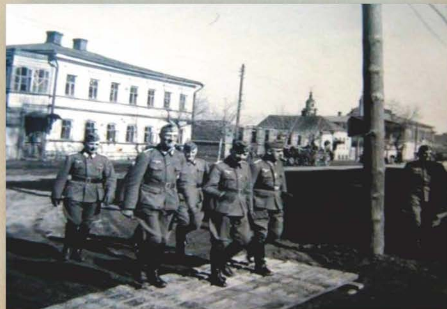
Оккупация. Орел, улица Карачевская (Сакко-Ванцетти)