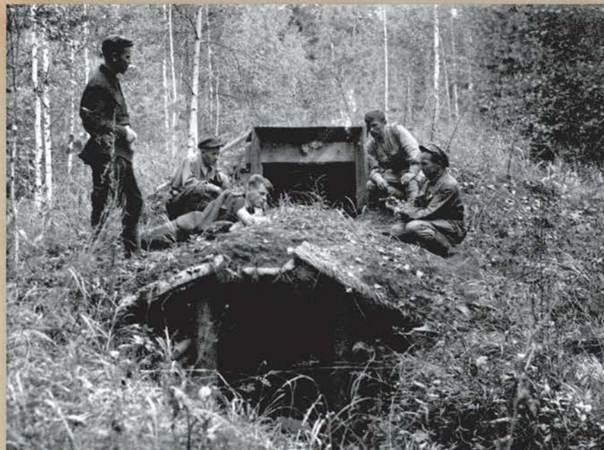
Брянский лес. Партизанская землянка