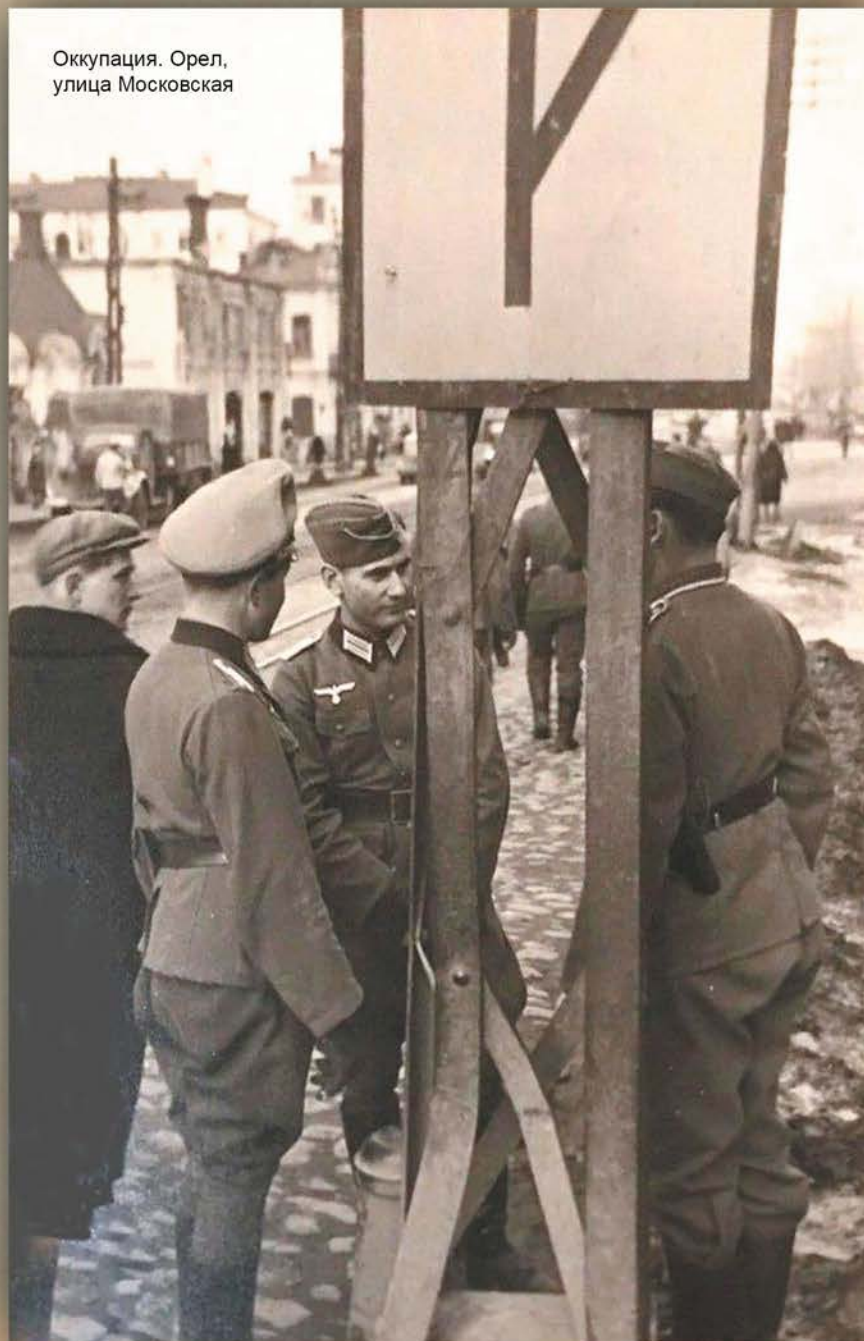
Оккупация. Орел, улица Московская