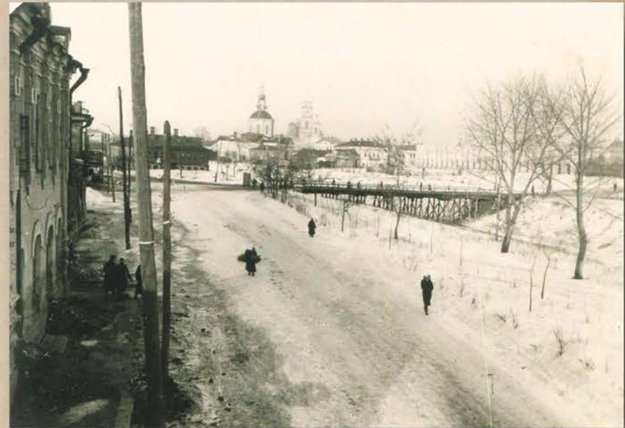
Оккупация. Орел, Левый берег Орлика