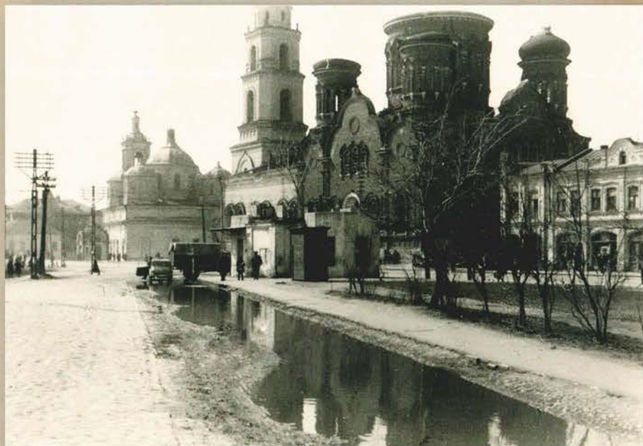
Оккупация. Орел, Первомайский сквер (с 1943 года - сквер Танкистов)