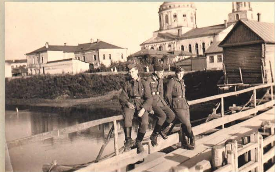
Оккупация. Орел, временный мост на правый берег Орлика