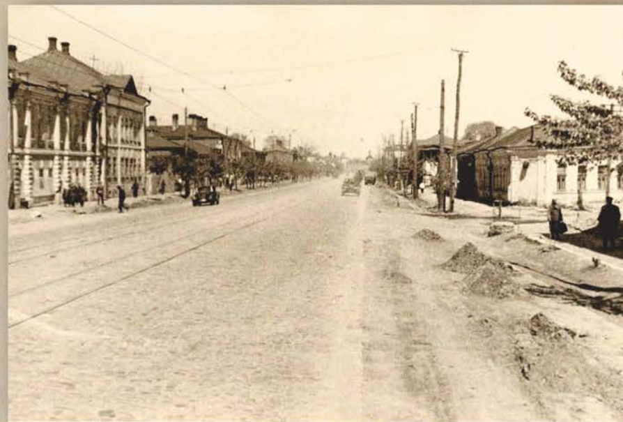
Оккупация. Орел, улица Комсомольская

12 июля из Дмитриевского партизанского отряда пошли нелегально старым маршрутом в Брянский лес. Дошли до дер. Голышено и наткнулись