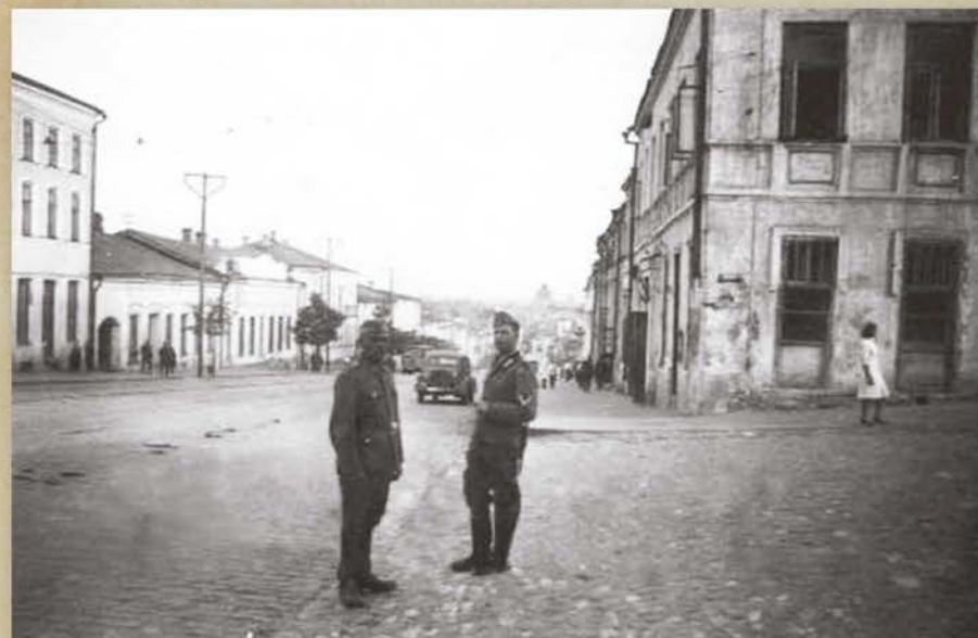
Оккупация. Орел, улица Ленинская (Болховская)